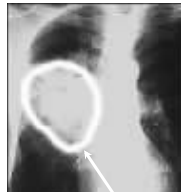
治疗前肺部肿块大小为5cm