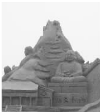
鉴真东渡主题沙雕