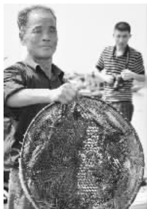
蟹农展示刚捕到的大闸蟹

昨天上午,2011苏州阳澄湖大闸蟹开捕仪式正式启动。今年的蟹格外肥,蟹农们个个笑得合不拢嘴。