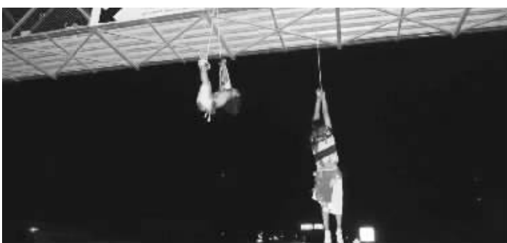
两具尸体13日早上被发现

在墨西哥北部城市塔毛利帕斯州的一座人行桥上,日前突然出现了一对双手被吊的男女,这对男女被虐杀而死,女方还被开膛破肚。更可怕的是,残忍虐杀的动机不是仇杀也不是情杀,而是要警告社交媒体用户小心说话,别在网上抨击墨西哥毒贩。