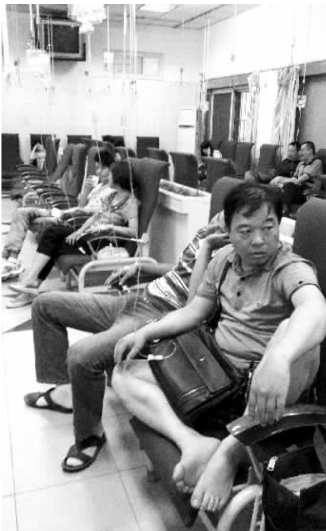
瀚斯宝丽的员工上吐下泻,部分员工在迈皋桥医院急诊注射室内挂水

条腿都软了,身上一直淌虚汗。”和小陈一样,刘师傅下午3点多开始感到恶心,吐了两次,1小时后开始拉肚子。“我撑到下午6点下班,实在撑不下去了。”刘师傅说,5点多的时候,车间楼上楼下加起来有30多人都出现了上吐下泻的症状,有人向领导反映此事。随后,食堂负责人组织了一辆大巴和几辆小车,把众人分批送往迈皋桥附近的几家医院治疗。此外,还有一些员工自行打车到医院看病。据就诊的大部分员工反映,当天的午餐中有土豆丝炒肉、青椒洋葱、空心菜和包菜,还有黄瓜鸡块盖浇饭、炒面等,种类丰富。不少人觉得,可能是菜中的肉制品出了问题。急诊医生也向记者证实,前来就诊的该公司员工有二三十人,大部分诊断为肠胃炎,有疑似食物中毒的症状。该公司食堂负责人孙先生表示,公司食堂有着严格的管理制度,每餐都会留样,目前暂不知是何原因出现此类情况。腹泻员工人数正在统计之中。而据该公司在迈皋桥医院的员工反映,出现上吐下泻的员工人数应该在30人以上,因为还有不少人去了省中西医结合医院等。昨晚9点多,栖霞区疾控中心的工作人员也已介入调查此事。(王先生线索费80元)