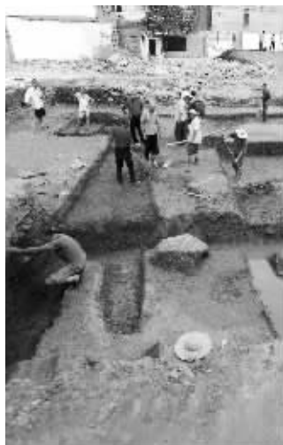
南京户部街考古工地发掘现场,专家认为应该是千年前的南唐皇城遗址

这个工地是否如网友猜测,是明代的户部办公地点?现场一位考古人员说,这里和明代的户部一点