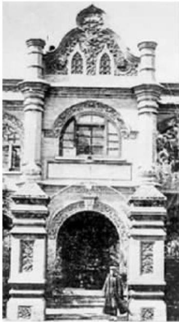
女师大校门 资料图片

现在,我们回头来看看本文开头所提的问题。答案是:小科长牛!但我觉得,比小科长更牛的,是民国时代的文官制度,它们从原则上斥责了下级是上级奴仆的状态,用法律捍卫了先服从法律后服从上级的文官准则,用条文确定了上级处分下级的法定程序。否则,近代史上赫赫有名的章部长怎么会把自己手下一个小小科长告赢了? 章敬平《文史参考》