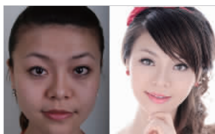
白哲鲜嫩的肌肤是世界上最美的霓裳

进入秋季,皮肤日渐暗沉。夏季炎热炙烤的色沉渐渐凝固下来,脸上的皮肤又衰老了一岁。