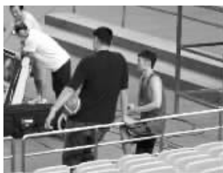
姚明明和刘炜哥俩好