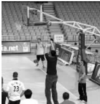
“姚解说”也来秀球技