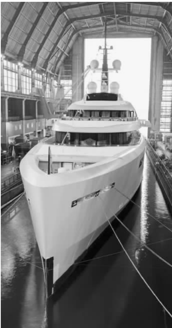
花费了1亿英镑建造的游艇“瓦瓦二世”号