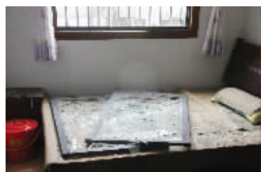
邻居家的玻璃都被震碎了