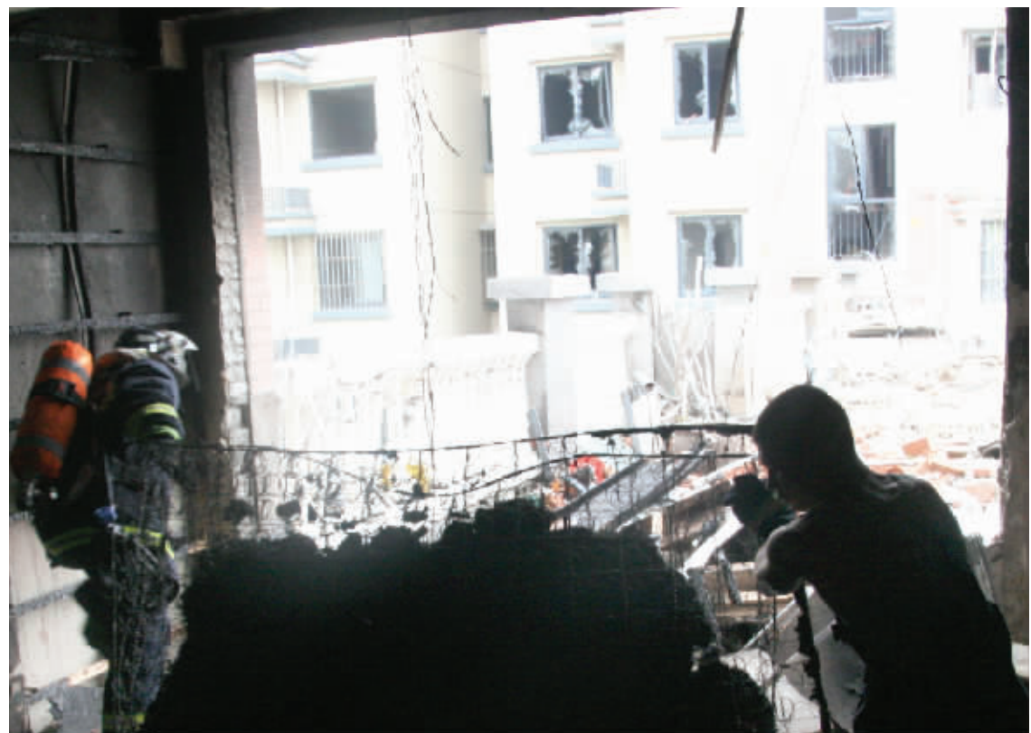
16号楼206室里已经面目全非

“前后大概10分钟左右就扑灭了火”,因为闻到空气中有煤气味,孟韶燕还特地楼上楼下跑了一圈,叮嘱大家不要用火用电,“这时就听见远处有消防车的声音,就在孟韶燕心里嘀咕的时候,一声更大的爆炸声响起,“我心想坏大事了,这爆炸感觉比发生在我家里的都大”。