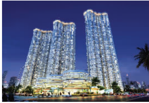
滨江壹号夜景璀璨动人