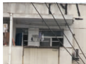
打弹弓的男人租住在这里

民警派人蹲守在嫌疑楼栋对面邮政局的二楼,还架了一台摄像机。民警守候了两天后,9月2日,摄像机捕捉到了一个可疑的画面:在嫌疑楼栋6楼最东头的阳台上,一个赤膊男人做了个拉弹弓的动作。他会不会就是嫌疑人?