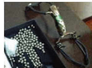
民警查获的弹弓