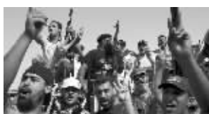
拜尼沃利德反对派武装人员庆祝取得的进展

的黎波里的一名反对派军事官员5日说,据他们掌握的情报,卡扎菲的两个儿子赛义夫和穆塔西姆已经离开拜尼沃利德,逃往苏尔特。 中国日报