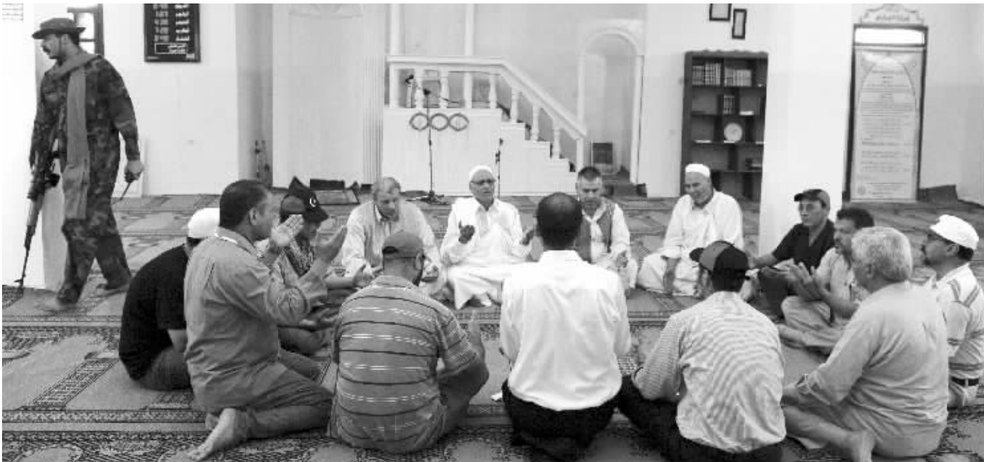
利比亚反对派武装人员与部落长老在谈判

利反对派先前的在黎波里逮捕19名乌克兰人,称他们受雇于卡扎菲政权,充当卡扎菲武装的狙击手。