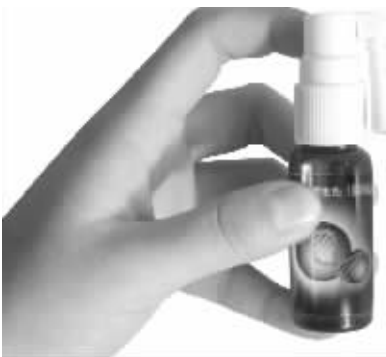
专克皮肤顽癣的神奇药水

据悉,“霍氏鲜清”正在全国举办“试用无效,全额退款”大型公信活动(买3盒20毫升或1盒120毫升送一瓶10毫升试用装),我市皮肤病病友可直接到康鑫药店(长乐路沃尔玛超市(原好又多超市)对面)、志信堂药店(鼓楼口腔医院旁)、中央门国盛大药房(中央门邮局旁)、新街