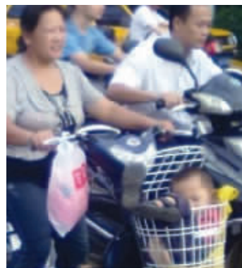
做小孩子呢，最重要的就是睡觉