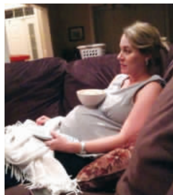
怀孕最大的好处在于此