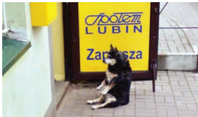
我走得累死了，歇一会