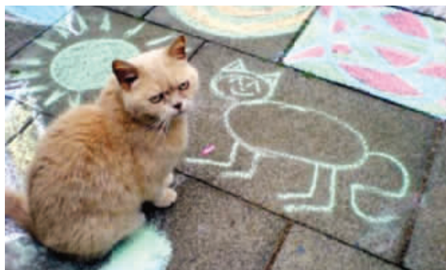
你画的这小细腿是我吗？