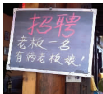
谁不去应聘谁就是傻子