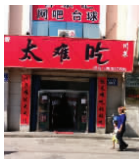
你要么真难吃，要么不诚实