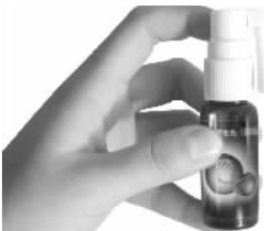
专克皮肤顽癣的神奇药水

据悉,“霍氏鲜清”正在全国举办“试用无效,全额退款”大型公信活动(买3盒20毫升或1盒120毫升送一瓶10毫升试用装),我市皮肤病病友可直接到康鑫药店(长乐路沃尔玛超市(原好又多超市)对面)、志信堂药店(鼓楼口腔医院旁)、中央门国盛大药房(中央门邮局旁)、新街