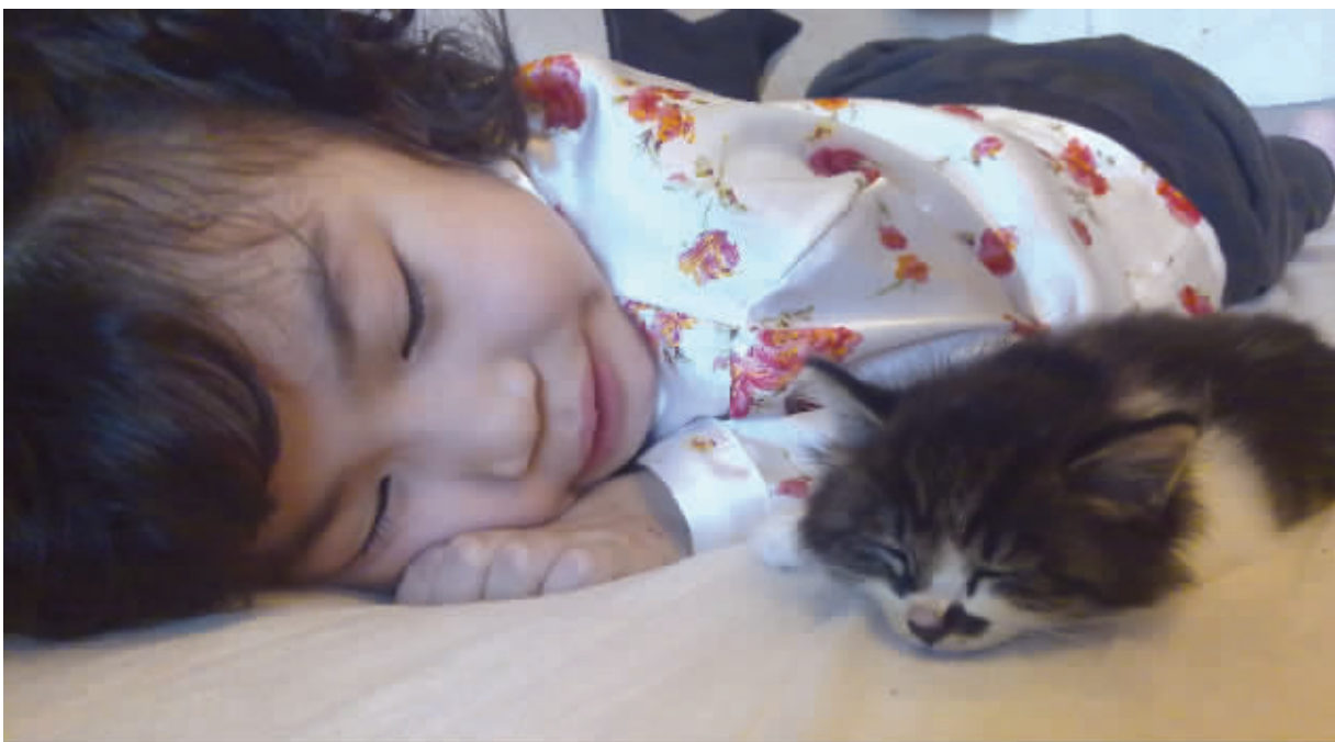
一只流浪的小猫咪被小可看见,并收养起来,小猫咪从此有了一个幸福的家。瞧,两个宝贝睡得多香。8月25日摄于家中 (作者爱可可获30元话费)