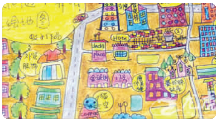
图上有许多学生常去的地方:餐馆、书店、咖啡店等