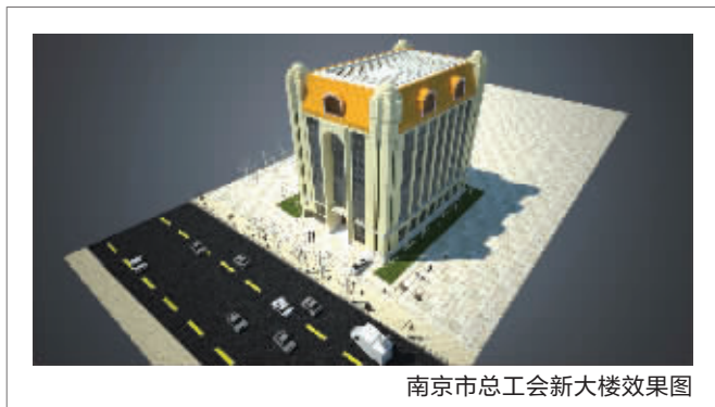
南京市总工会新大楼效果图

另外,南京市第一次出台的非文物类优秀民国建筑名录一共42幢,南京民国盐务署就在列,排在第28位,标注为建于1930年代,建筑风格为“现代式”,等级为2-B,不过在2008年,南京出台了第一批非文物类的民国建筑保护名录,一共66处建筑入选,南京民国盐务署大楼却榜上无名,也成了它可以通过规划公示重新翻新的依据。