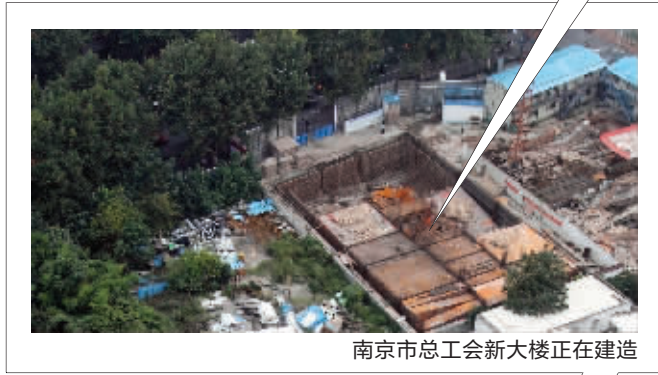
南京市总工会新大楼正在建造