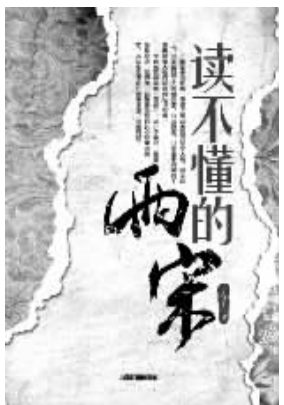
丁守卫 著 中国铁道出版社友情推荐

该书作者周文重,祖籍江苏,1945年出生于重庆,幼年随父母迁居上海。20世纪60年代毕业于北京对外贸易学院,1973-1975年在英国巴斯大学、伦敦经济学院进修。留英回国后供职于外交部,先后在翻译室、美大司工作;历任驻巴巴多斯、安提瓜和巴布达、澳大利亚、美国大使;曾任外交部部长助理、副部长。本书以白描的手法忠实地记录了作者2005-2010年任中国驻美国大使期间亲身经历的十二件事,从一个侧面反映了中美关系的历程。