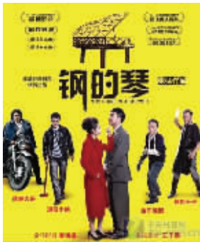
心有多大，舞台就有多大