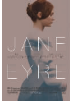
追逐理想，坚持信念