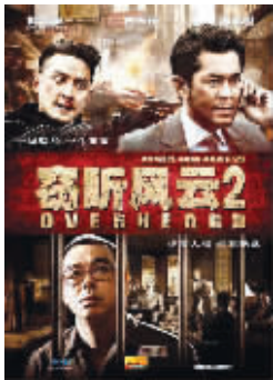
以身殉道，震撼人心