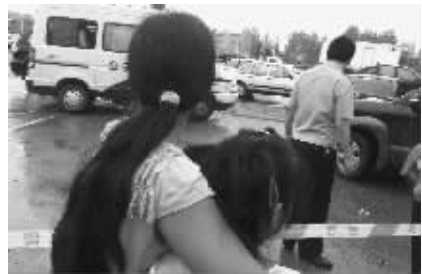
获救的小女孩在妈妈怀里哭个不停