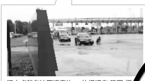
狙击点就在这面墙旁边