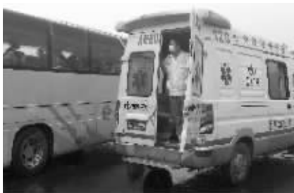
急救车一直在现场随时准备送伤员