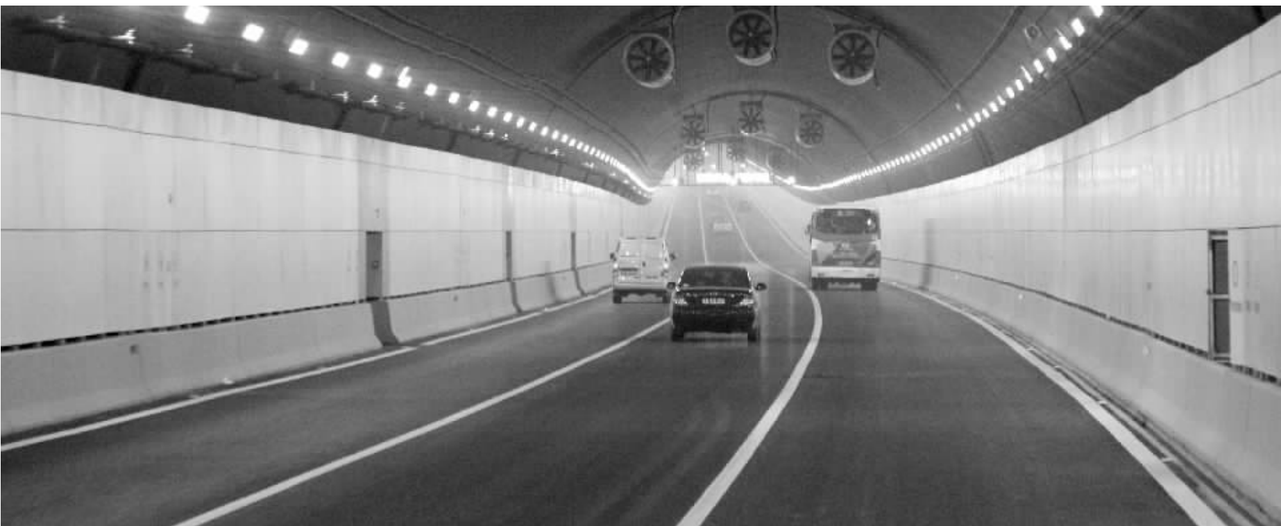
由于收费较高,与长江大桥相比,纬七路过江隧道“清闲”了许多(资料图片)

昨天,快报记者从南京市委常委会获悉,纬七路过江隧道(长江隧道)拟从9月6日起实施优惠方案,本地小车单次由目前的15元降为10元,月票将由现在的400元降为300元,如一次性购买全年月票,还可按总票价的97%给予优惠。据介绍,这个优惠方案初定将持续至2016年9月6日。 8月2日,江苏省委常委、南京市委书记杨卫泽与网友网聊的时候曾表示,将降低纬七路过江隧道的收费标准,缓解大桥压力。而昨天市委常委会传出的信息也显示,除了降低纬七路过江隧道的收费标准,南京还将出台一揽子举措,缓解“过江难”问题。