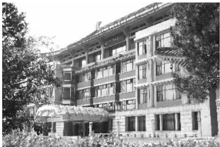
胡适留下的藏书保管在北大图书馆 资料图片