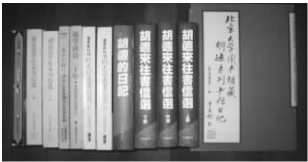
与胡适相关的书籍 资料图片