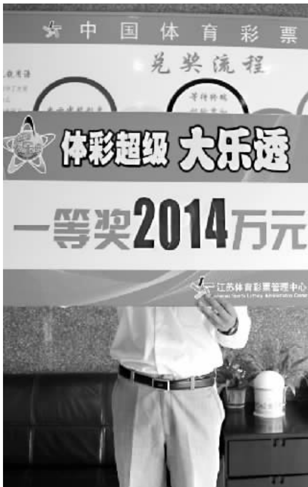
彩民到省体彩中心来领奖

“我当时也是憋了一口气投了3倍”,小王最后笑呵呵地说道。而对于新鲜出炉的大乐透2.48亿巨奖,小王更是赞不绝口:“来之前我就知道了,这个大奖真是太厉害了,我只投了3倍,他可是30倍啊,我连他的零头还不到啊。”当谈到如何打算时,小王表示先要冷静一段时间,暂时不会改变现有的生活,不过现阶段提高一下生活质量还是可以的。 通讯员 郑俊春 快报记者 付智勇