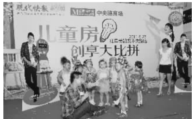
幼儿园环保时装秀是演出中的一大亮点

欣赏节目同时,拉票活动也进行着。由儿童知名品牌芙莱莎、我爱我家、四级缤纷提供的5000元、2000元大奖分外诱人!排行榜前3名票数每分钟都在刷新,第一名票数已破万。所有到场的参与家庭都会自动获得由主办方送出的1000张选票。大奖究竟花落谁家,答案将在今日中午12点揭晓。敬请关注 http://www.qbabyonline.com/bbroom/ 时荣