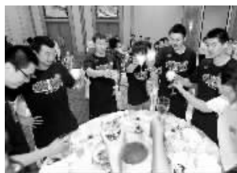
同曦队员庆祝夺冠

昨晚,江苏同曦篮球队卫冕NBL总冠军庆功酒会在金陵饭店举行。在庆功仪式上,江苏省体育局副局长杨国庆代表省体育局对同曦队进行了嘉奖,并鼓励同曦男篮要在下赛季再拿冠军。他同时透露,中国篮协党委书记刘晓农已经表态:“假如同曦队明年实现三连冠,将肯定能升上CBA。”这无疑是在给同曦队打了一针强心剂。