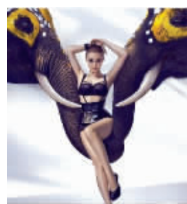
范冰冰疑似光头写真