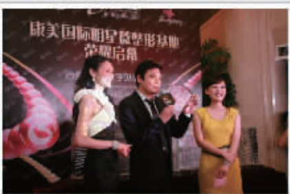
罗嘉良、郭可盈共同见证康美国际明星微整形基地启幕

胡朝辉院长: 在好莱坞, HGH 是大牌明星们致点机能抗衰老产品; 在亚洲, 日、韩、中国台湾等地也有上百位明星正在使用它。HGH 运用的顺势疗法是目前全球公认最安全的。