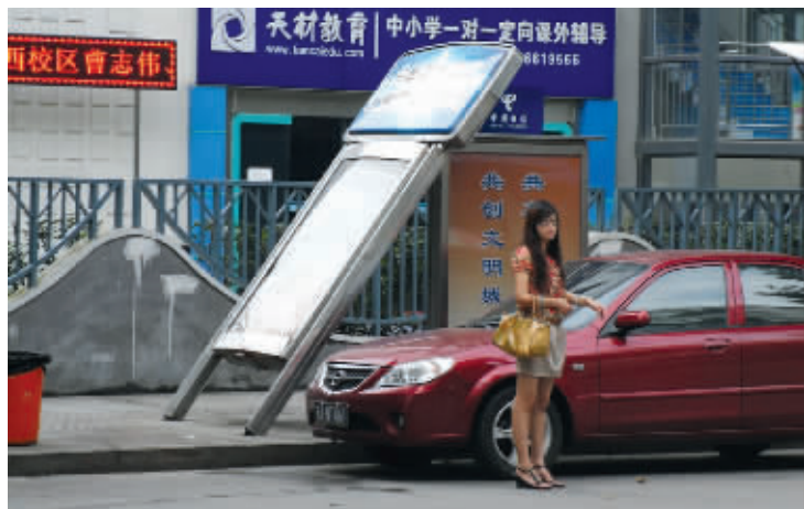
凤凰西街这个公交站牌,上周六就倒下来了,两天了,也不见有人来扶一下。早上上班时,还倒在那里。8月29日早上摄于凤凰西街。