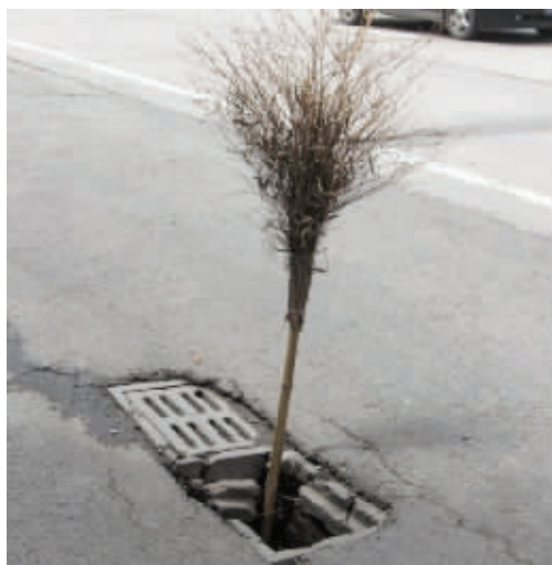
迈皋桥公交车站旁的慢车道上,一块水泥盖子被汽车轧碎七天了,好心市民设置了警示标志——一把扫帚,但晚上光线不好还是很危险,希望有关部门尽快把盖子补上。