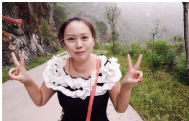
最近网上很火的hold姐,能瞬间变格格,我也能瞬间变成双眼皮!8月28日摄。