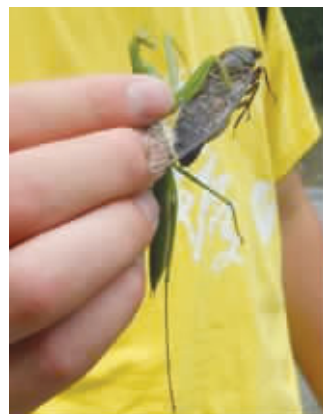
这才是真正的螳螂捕蝉黄雀在后!8月27日摄于紫金山。