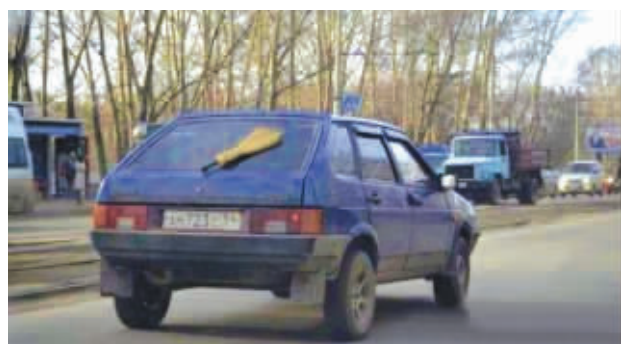
亲爱的,我把雨刮器修好了