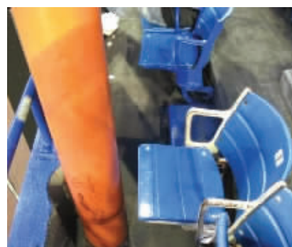
这比站票还要坑爹啊!