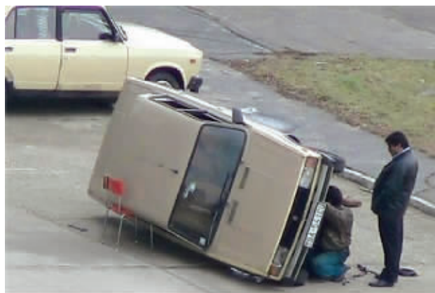
有好椅子,更好好身手!