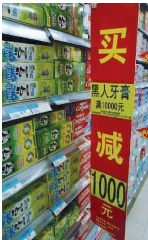
这是逼我把一辈子的牙膏都买了