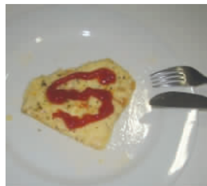
超人也有专用早餐