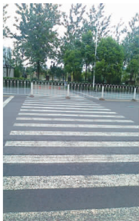
谁说翻栏杆的行人都不守法?