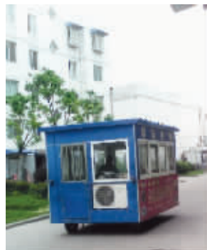
豪华房车,带厨房带空调