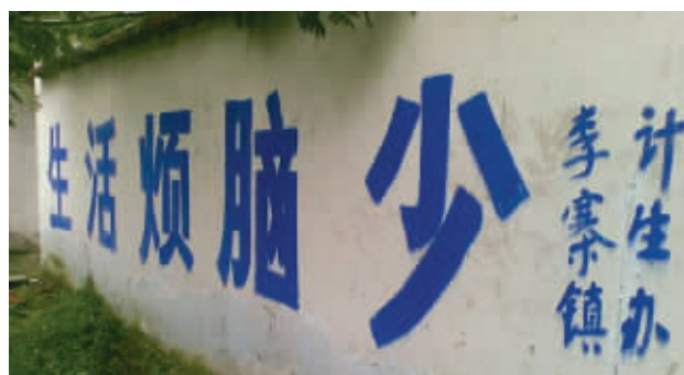
不怎么认字当然烦恼就少