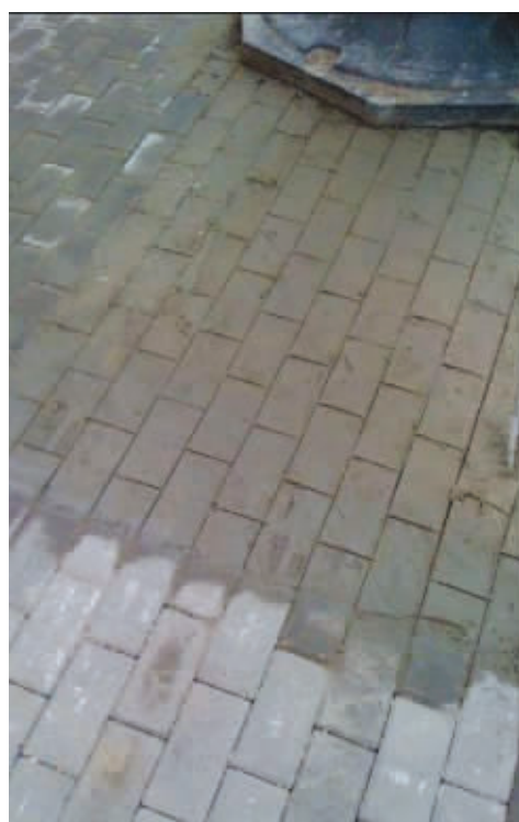
原来水泥上画几根线就是砖了