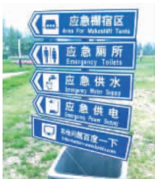
百度对此表示压力不大