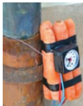
切,一只兔子就能搞定了