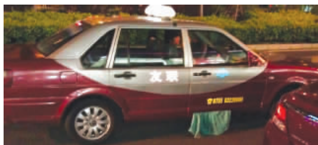
明白为何要推行“胡服骑射”了吧