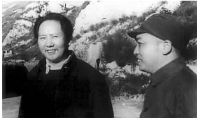
毛泽东和彭德怀在延安 资料图片

的《告同志和民众书》,其中写道:“党内大难已经到了,毛泽东叛变投敌了”,发出“打倒毛泽东,拥护朱、彭、黄”的口号。