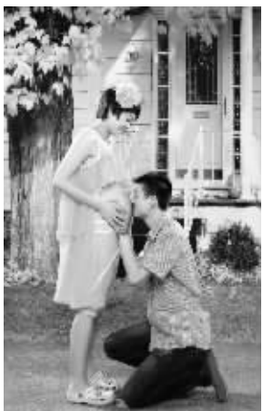
爸爸:“亲亲我的宝贝!”