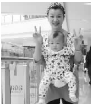
袋鼠妈妈,背着袋鼠宝宝累不累?