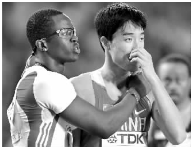
场上是对手,场下是朋友