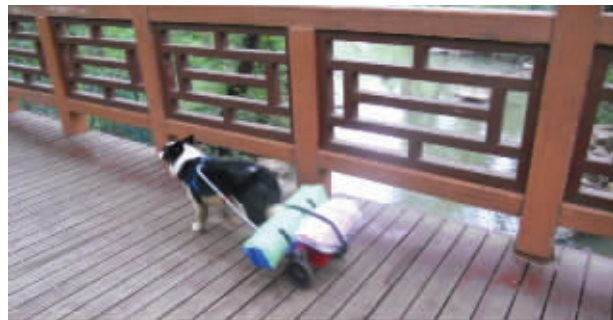
这么能干的狗狗,我也想养一只……8月21日摄于植物园。