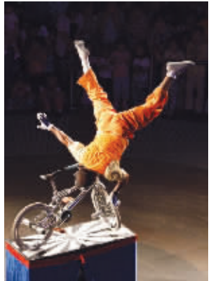
绝活,玩的就是心跳。8月26日摄于水游城