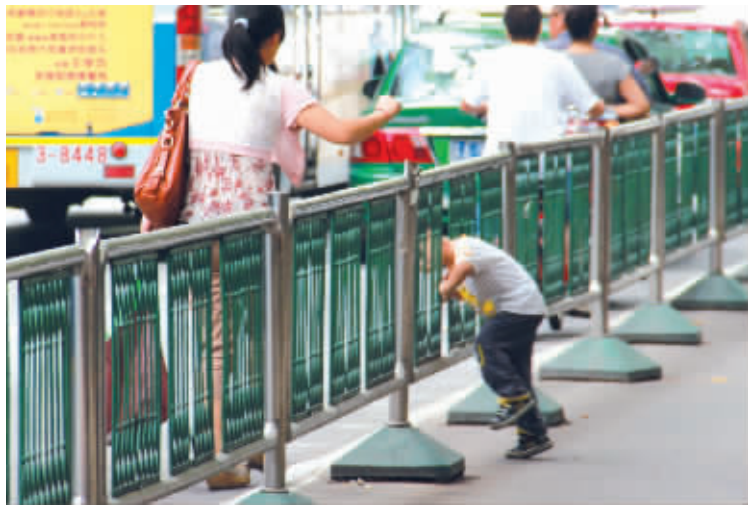
脑袋过去了,身子还在这边,老妈,我卡住啦!(得批评家长几句,不能带孩子这样过街的。)8月27日摄于丹凤街。