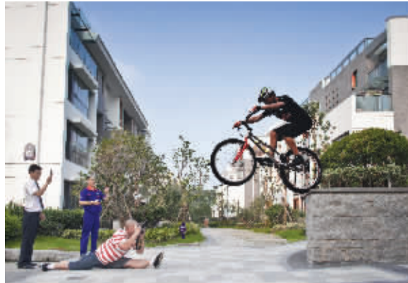
能把一辆自行车耍得这么出神入化的,实在不多。摄于紫庐小区。