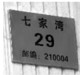
鼎新路上的门牌五花八门