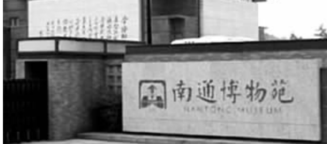
清光绪年间创建的南通博物院