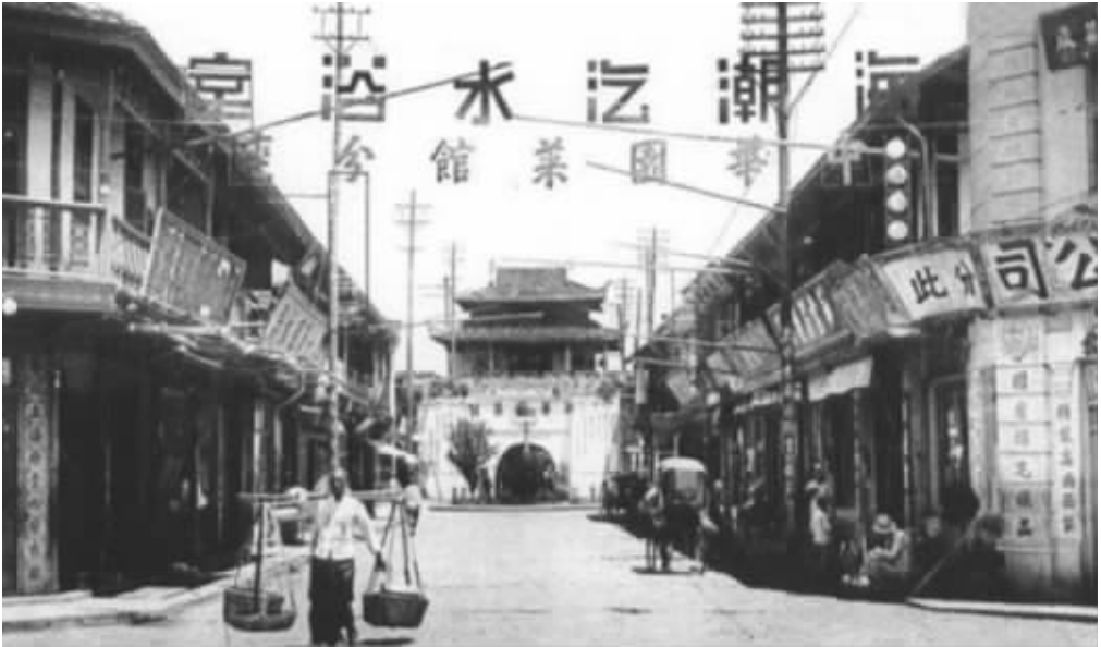
民国时期的南通街景，俨然一个繁华的“小上海”