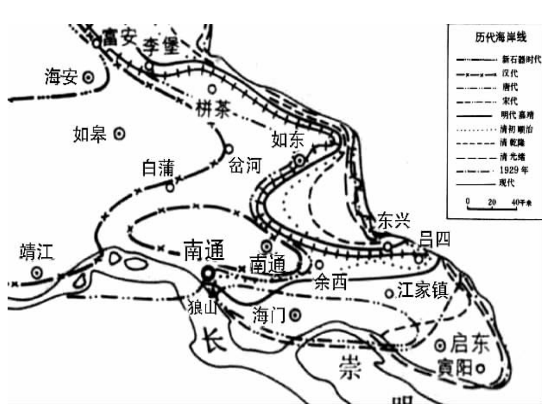
“十里不同音”的南通话,其形成和南通的建城史有着密切关系 制图 俞晓翔