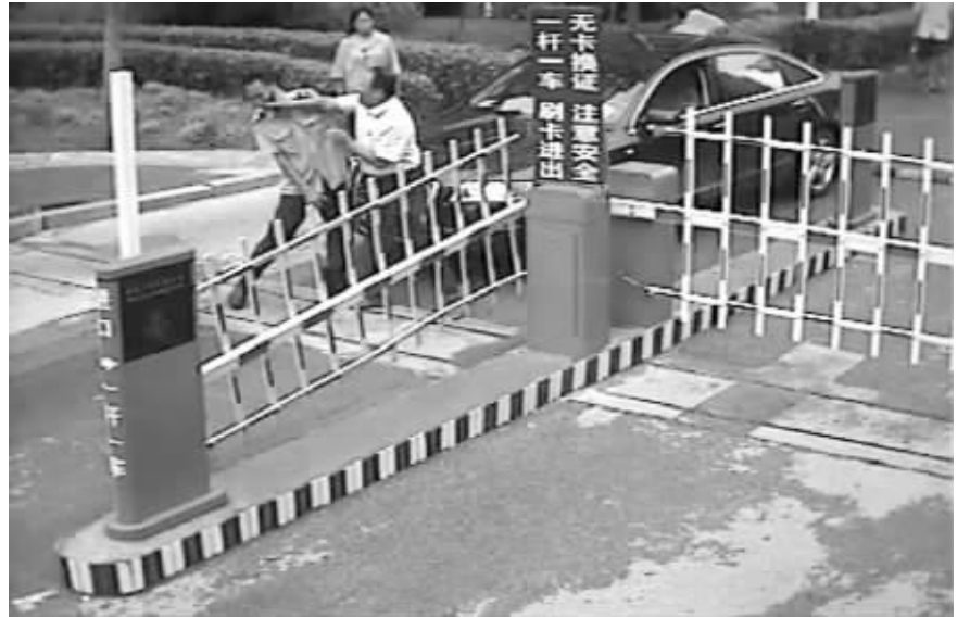
一拳打中一名保安

业主未缴停车费，便想驾车离开小区，保安阻拦后，这名业主不但把小区大门砸坏，还对着两名保安拳打脚踢……8月24日上午，这一幕发生在玄武区北苑之星小区大门口。昨天，有人将事发经过发到了网上。