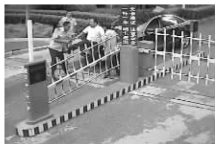
一脚踢中另一保安