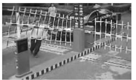
小区栅栏大门被推到路边

的这名业主40多岁，听说是做工程的，车子是他的私家车。根据物业规定，车子停在小区里过夜，每晚停车费是10元，如果是包月，停车费是280元。但这名奥迪车主不肯缴费，有时他将车子停在小区外面的马路边，有时则趁保安不注意，将车子开进小区，在不允许停车的位置乱停车。保安是屡次劝阻无效后，才将他的车子锁住的，目的不是激化矛盾，而是想与他进行进一步的沟通，没想到这名业主根本不配合，反而态度嚣张，对保安动了手。