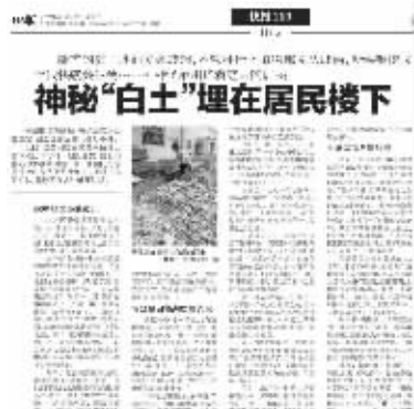
去年11月2日快报相关报道

去年11月2日,快报报道了六合区玉带镇滨江中心村一期土地下存在掺杂着化工废料的“白土”,村民担心对身体健康有影响一事。如今大半年过去了,“白土”仍在,村里空气中还是飘散着一股异味,不少村民担心气味会损害身体健康,迟迟没有搬进新居。