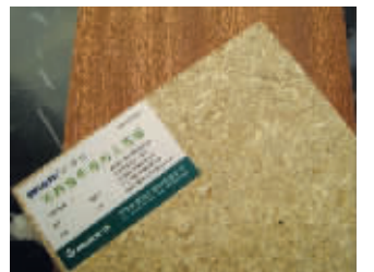
盈科制木所有产品的基材都选用万华禾香板