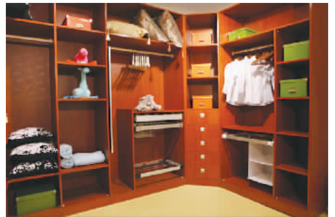
盈科制木设计生产的整体衣柜