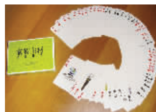
凭此扑克牌,享受104户商家2%~8%的再优惠

在本届主材展上,主办方南京装饰材料商协会将免费发放一万副扑克牌和《家装主材消费手册》。相关负责人介绍,该扑克牌不仅是一副“优惠牌”,还是一副“万能牌”,扑克牌上共罗列了104个品牌的优惠信息,可以在成交价的基础上再让利2%~8%,优惠将从展会结束的第二天(8月29日)开始生效直至年底。