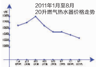
数据源于南京家电市场综合统计