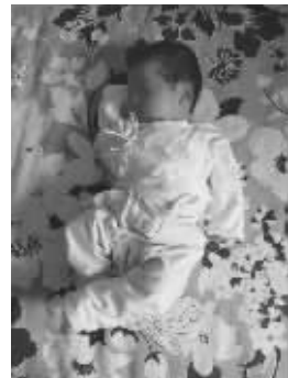
▲小公主慵慵懒睡姿 ▲别吵,困着呢 ▼美容觉睡出双下巴