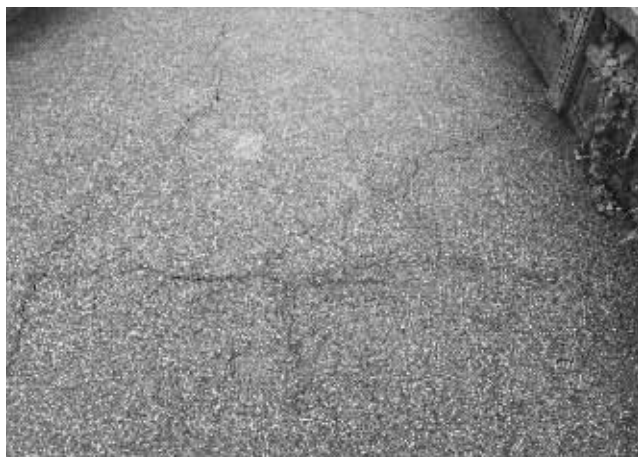
万浪桥桥面多处出现裂缝