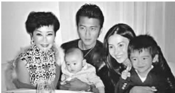
锋芝离婚,苦了孩子

谢霆锋与张柏芝近日分别通过所属的经纪公司发出联合声明,正式宣布两人决定离婚。声明中主要明确了两人将共同拥有儿子Lucas和Quintus的抚养权,但是对