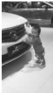
我想把这车子推回家,哈哈