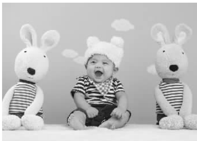
男宝宝 大名 董博文 小名 天一 出生日期 2011年5月1日 出生重量 8.1斤 出生身高 51厘米 出生医院 无锡妇幼

妈妈们可以在微群中攀比宝宝美图,感慨下育子的操心事,或者谈论一下南京这座美好城市的多彩生活!