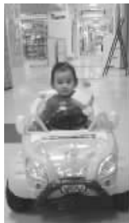
妈咪给我买了辆粉色小汽车,开心