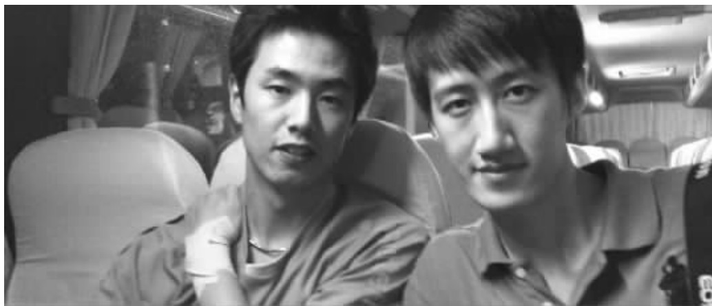
快报记者和朱世赫(左)合影

昨天,2011年中国乒乓球公开赛在苏州开战。虽然首日没有韩国名将朱世赫的比赛,但晚上7点左右,他还是坐上了开往比赛场馆的大巴。在大巴上,朱世赫告诉快报记者,他去过中国很多城市,南京是他很喜欢的城市之一,特别是雄伟的中山陵让他印象深刻。