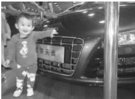
等长大有钱了,就送妈咪一辆