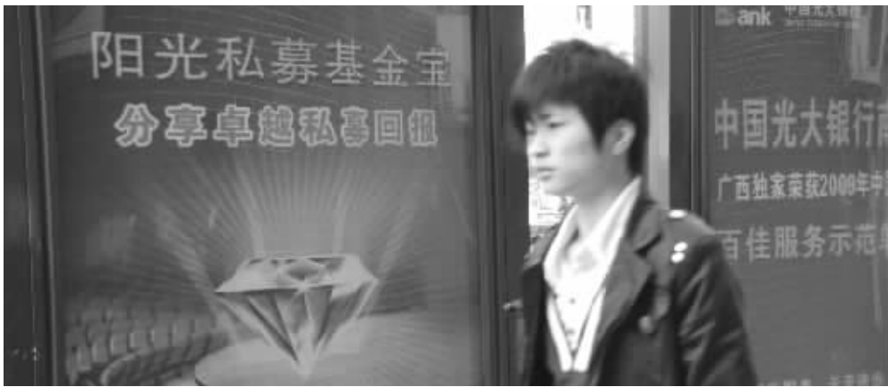
在银行也能购买私募产品

记者了解到,投资者目前可通过银行、券商、信托、第三方平台以及私募基金公司官方网站等多个渠道购买到私募产品。虽然今年以来私募整体表现不佳,但一些投资方向相对“另类”的产品表现突出,最高收益率超过30%。