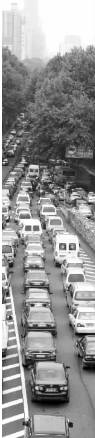
中山门附近拥堵严重

而且,路面值勤的交警发现,昨天等公交车的市民太多,站台不够站之后,许多市民都站到了快车道上,公交车上下客的时候,为了确保这些等车人的安全,又占据了另一股车道,导致后面的车根本无法前行,这也影响了通行效率。交管部门预计,在地铁恢复运营之前,中山东路可能还会保持这种通行状况。南京交警二大队副大队长罗盛平告诉记者,昨天早高峰,他们就派出了30多名交警,在中山东路沿线指挥交通,警力布置比平时多了三分之一。