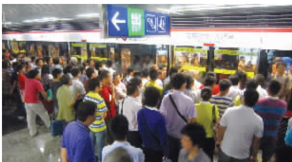
大行宫站昨十分拥挤