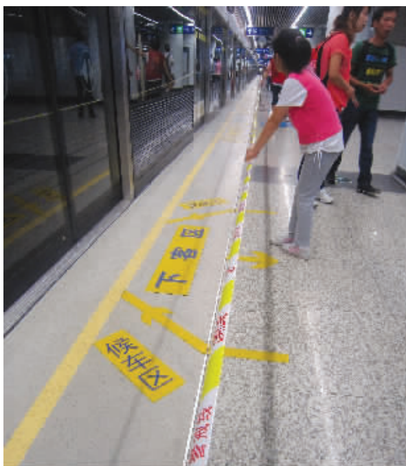
二号线新街口站,往经天路方向去的一侧站台边拉起了警戒线

据地铁工作人员介绍,在孝陵卫中转,往经天路方向候车时间是8-10分钟,但是往大行宫方向,候车时间25-28分钟。也就是说,往经天路的列车来三趟,才会有一辆往大行宫的列车,不过这段时期内,行车间隔将不断变化,并不固定。这也使得从仙林方向开往新街口的地铁,在经天路到孝陵卫之间,经常出现临时停车的情况。