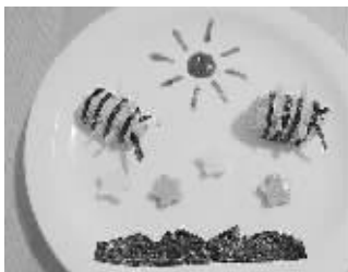
小蜜蜂饭团