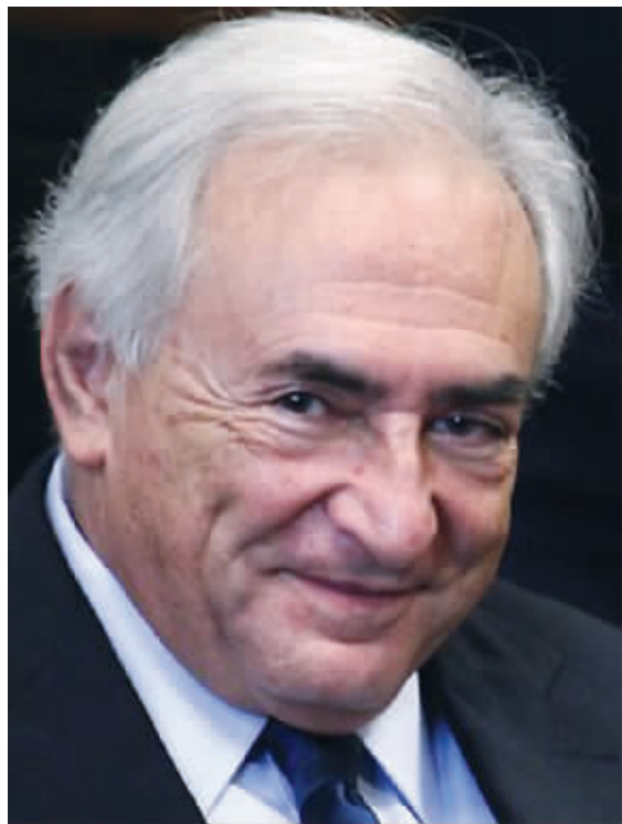
多米尼克·斯特劳斯卡恩 (资料图片)