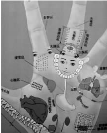
微博上疯转的一张图

记者找到南京一家医院推拿科的医生,他笑着说,这张图其实流传很久了,和“足部按摩图”一样,被很多人认为有效。从医生实际经验来说,认为有一定的参考意义,但临床的医生不会用这样的方法去给病人按摩。