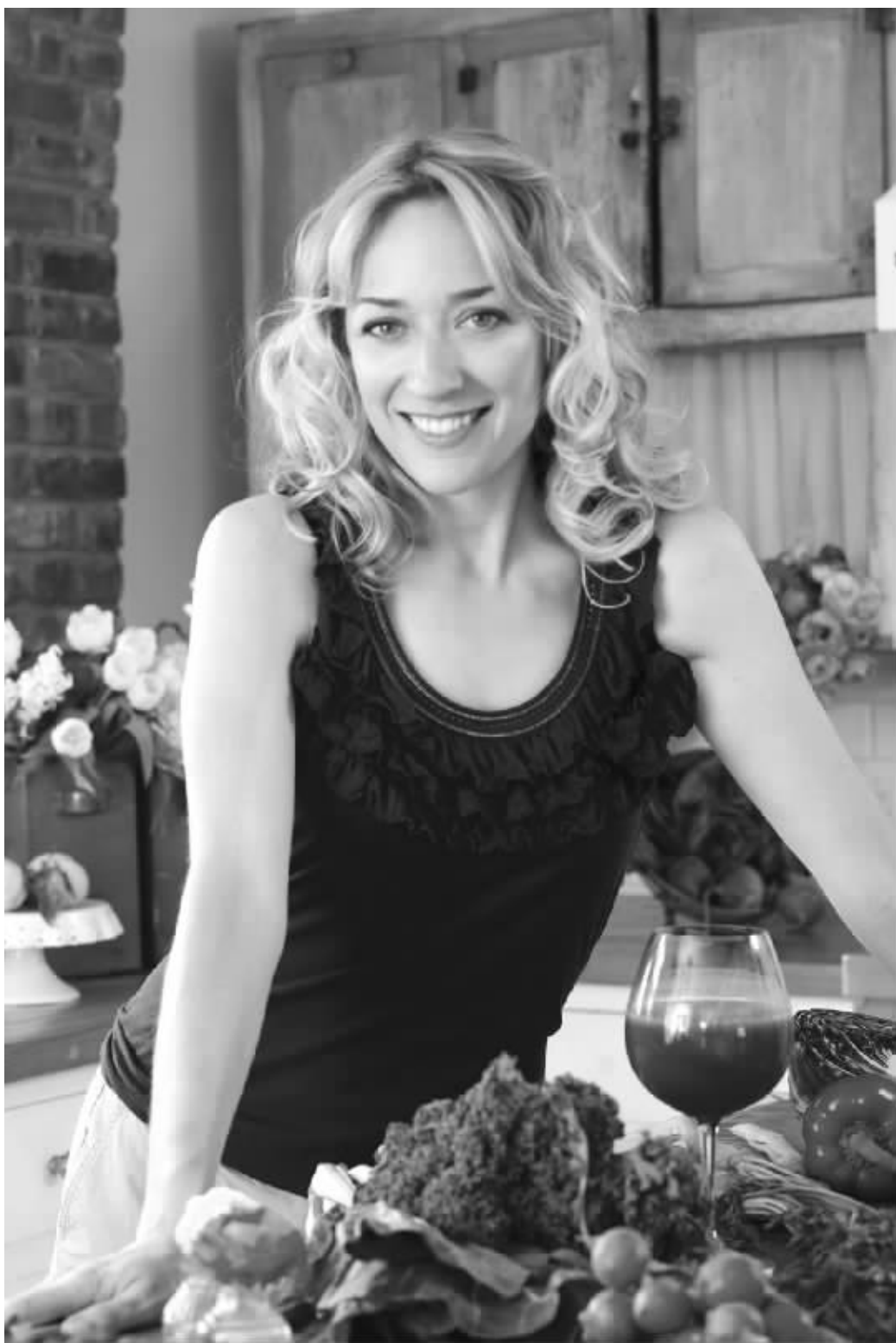
美国畅销书作者、癌症患者克利丝·卡尔

的领域——癌症的世界。她曾写道:“不要因为你接受了灌肠治疗,就觉得必须生活在充满杀菌剂的环境中,用时髦和美丽来装扮你的生活吧。”这就是克利丝号召人们对待癌症的方式。