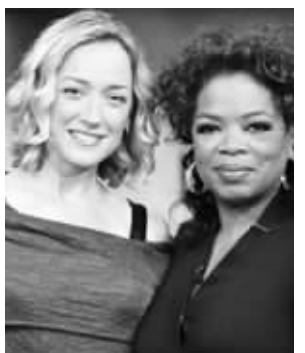
克利丝·卡尔和奥普拉

的领域——癌症的世界。她曾写道:“不要因为你接受了灌肠治疗,就觉得必须生活在充满杀菌剂的环境中,用时髦和美丽来装扮你的生活吧。”这就是克利丝号召人们对待癌症的方式。